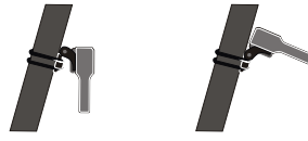
Group riding No dazzle

Fix the base mount with the O ring to the seat post ( \Phi 24-36mm) or compatible helmet, then slide the light into the base mount; Adjust the angle for you needs: